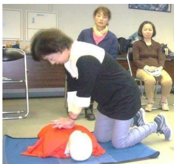
心肺蘇生の基本 胸骨圧迫

周囲の人に声をかけて 119番 通報を頼み AED を持ってきてもらいましょう 周囲の安全を確保し、心肺停止が疑われる人には 心肺蘇生 を！